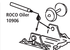
ROCO Oiler 10906

Les pièces de finition illustrées sont à monter par le modéliste. Le jeu de pièces peut comprendre d'autres pièces (non illustrées) qui sont destinées à autres versions du modèle et qui sont superflus à la variante présente.